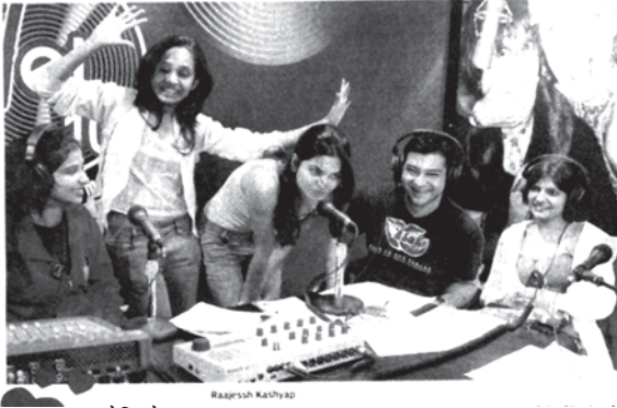
रेडियो गा गा

But what has made RJ-ing the coolest choice? Perhaps, it is the rising level of awareness among youngsters, who want something more and extraordinary when it comes to career. No run of the mill stuff for them because they are willing to risk and experiment. As actress Preity Zinta, who was an RJ in