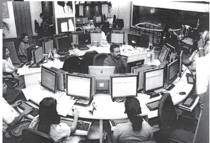
21वीं सदी का दूरदर्शन समाचार कक्ष, भारत

औद्योगिक क्रांति के साथ ही, मुद्रण उद्योग का भी विकास हुआ। कुलीन मुद्रणालय के प्रथम उत्पाद साक्षर अभिजात लोगों तक ही सीमित थे। तत्पश्चात् 19वीं सदी के मध्य भाग में आकर जब प्रौद्योगिकियों, परिवहन और साक्षरता में और आगे विकास हुआ, तभी समाचारपत्र जन-जन तक पहुँचने लगे। देश के विभिन्न क्षेत्रों में रहने वाले लोगों को एक जैसे समाचार पढ़ने या सुनने को मिलने लगे। ऐसा कहा जाता है कि इसी के फलस्वरूप देश के विभिन्न भागों में रहने वाले लोग परस्पर जुड़े हुए महसूस करने लगे और उनमें 'हम की भावना' विकसित