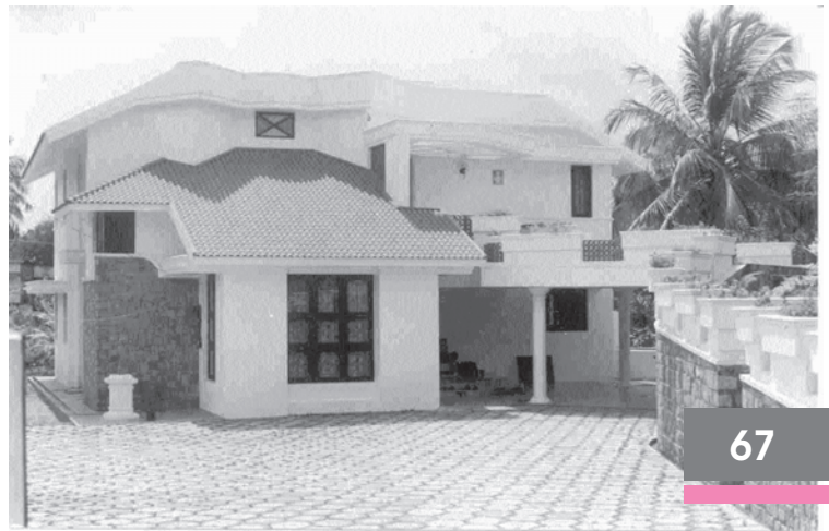
इस घर को देखिए। यह सुकुतम केरल के एक गाँव चक्कार में है यह पालघाट कस्बे से जो कि जिले से 3 किमी. की दूरी पर है।