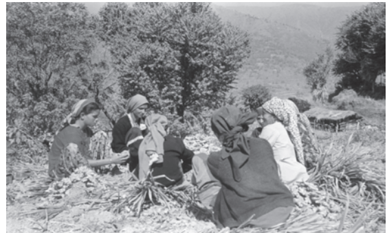
देश के विभिन्न भागों में कृषि कार्य

1960 व 1970 के दशक में कृषि विकास द्वारा ग्रामीण सामाजिक संरचना को बदलने वाला एक तरीका नयी तकनीक अपनाने वाले मध्यम तथा बड़े किसानों की समृद्धि थी, जिसकी चर्चा पूर्व भाग में की गई है। अनेक कृषि संपन्न क्षेत्रों जैसे तटीय आंध्रप्रदेश, पश्चिमी उत्तर प्रदेश तथा मध्य गुजरात में प्रबल जातियों के संपन्न किसानों ने कृषि से होने वाले लाभ को अन्य प्रकार के व्यापारों में निवेश करना प्रारंभ कर दिया। विविधता की इस प्रक्रिया से नए उद्यमी समूहों का उदय हुआ जिन्होंने ग्रामीण क्षेत्रों से इन विकासशील क्षेत्रों के बढ़ते कस्बों की ओर पलायन किया, जिससे नए क्षेत्रीय अभिजात वर्गों का उदय हुआ जो आर्थिक