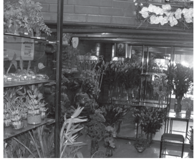
फूलों की खेती

बीजों तथा कृषि कार्य हेतु जानकारी का एकमात्र स्रोत होते हैं, और निःसंदेह वे अपने उत्पाद बेचने के इच्छुक होते हैं। इससे किसानों की महँगी खाद और कीटनाशकों पर निर्भरता बढ़ी है, जिससे उनका लाभ कम हुआ है, बहुत से किसान ऋणी हो गए हैं, तथा ग्रामीण क्षेत्रों में पर्यावरण संकट भी पैदा हुआ है।