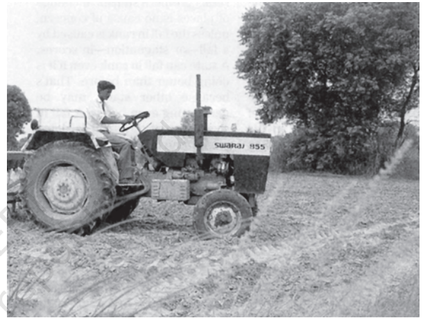
कृषि व्यवस्था में बदलती हुई तकनीकें

इस प्रकार त्वरित कृषि विकास वाले क्षेत्रों में पुराने भूमि अथवा कृषि समूह का समेकन हुआ, जिन्होंने स्वयं को एक गतिमान उद्यमी, ग्रामीण नगरीय प्रबल वर्ग के रूप में परिवर्तित कर लिया। लेकिन अन्य क्षेत्रों जैसे पूर्वी उत्तर प्रदेश तथा बिहार में प्रभावशाली भू-सुधारों का अभाव, राजनीतिक गतिशीलता तथा पुनर्वितरण के साधनों के कारण वहाँ तुलनात्मक रूप से कृषिक संरचना तथा अधिकांश लोगों की जीवन दशाओं में थोड़े बदलाव हुए। इसके विपरीत केरल जैसे राज्य विकास की एक भिन्न प्रक्रिया से गुजरे जिसमें राजनीतिक गतिशीलता, पुनर्वितरण के साधन तथा बाह्य अर्थव्यवस्था (मूल रूप से खाड़ी के देश) से जुड़ाव ने ग्रामीण परिवेश में भरपूर बदलाव किया। केरल में ग्रामीण क्षेत्र मूल रूप से कृषि प्रधान होने के बजाए मिश्रित अर्थव्यवस्था वाला है जिनमें कुछ कृषि कार्य खुदरा विक्रय तथा सेवाओं के एक विस्तृत संजाल के साथ जुड़ा हुआ है, और जहाँ एक बड़ी संख्या में परिवार विदेश से भेजे जाने वाले धन पर निर्भर हैं।