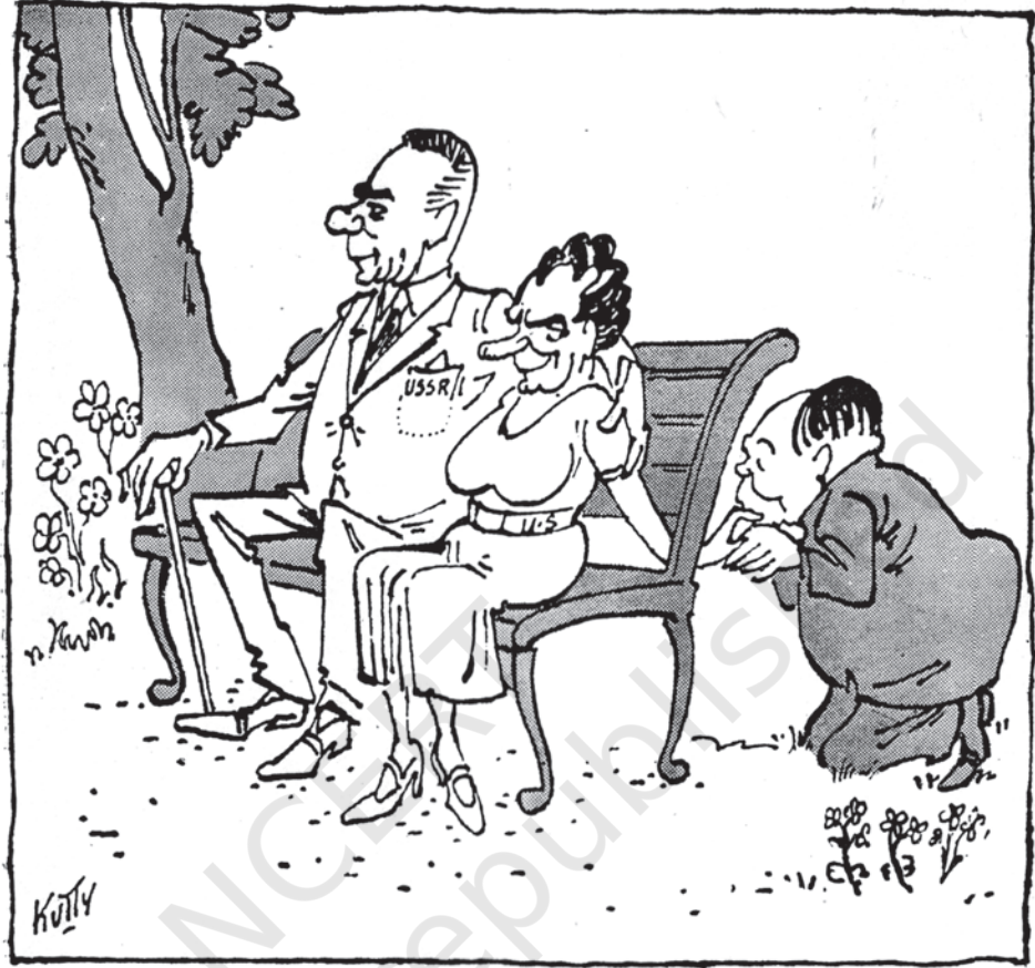
राजनीतिक बसंत - चीन के हाथों में अमरीका का हाथ

ये दोनों कार्टून मशहूर भारतीय कार्टूनिस्ट कुट्टी ने बनाए हैं। इनमें शीतयुद्ध को लेकर भारत के नज़रिए को चित्रित किया गया है। पहला कार्टून उस समय का है जब समाजवादी सोवियत गणराज्य को अंधेरे में रखकर अमरीका ने चीन के साथ गुपचुप दोस्ती गांठी। इस कार्टून में दिखाए गए किरदारों के बारे में और जानकारी जुटाइए। दूसरे कार्टून में वियतनाम में अमरीकी दुस्साहस को चित्रित किया गया है। वियतनाम-युद्ध के बारे में और जानकारी जुटाएँ।