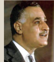
गमाल अब्दुल नासिर (1918-70)

सन् 1970 तक मिस्र के शासक। अरब राष्ट्रवाद, समाजवाद और साम्राज्यवाद-विरोध के लिए प्रतिबद्ध। स्वेज नहर का राष्ट्रीयकरण किया। इसकी वजह से सन् 1956 में अंतर्राष्ट्रीय संघर्ष हुआ।