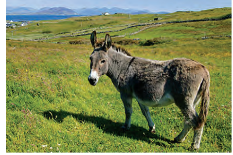
चित्र 9.2 खच्चर

यद्यपि कृत्रिम वीर्यसेचन की क्रिया को अपनाया जाता है फिर भी बहुधा परिपक्व नर तथा मादा पशुओं के मध्य होने वाले संगम से, उत्पन्न संकरण की दर से मिलने वाली सफलता कुछ कम ही होती है। संकरों के सफल उत्पादन में सुधार लाने के लिए अन्य विधियों का भी प्रयोग किया जाता है। मल्टीपिल औवियूलेशन, एम्ब्रियो ट्रांसफर (भ्रूण अंतरण) तकनीक गौ पशुओं में सुधार का एक कार्यक्रम है। इस विधि में, एक गाय में पुटक परिपक्वन तथा उच्च अंडोत्सर्जन को प्रेरित करने के लिए जब एफएसएच प्रकार का हॉर्मोन दिया जाता है। सामान्यतः प्रतिचक्र में एक अंडे की तुलना में 6-8 अंडे उत्पन्न होते हैं। पशु को या तो सर्वोत्कृष्ट साँड़ (बैल) अथवा कृत्रिम वीर्यसेचन द्वारा संगमनित कराया जाता है। 8-32 कोशिका अवस्थाओं वाले निषेचित अंडे को बिना शल्य चिकित्सा से प्राप्त कर प्रतिनियुक्त मादा (माँ) में स्थानांतरित कर दिया जाता है आनुवंशिक मादा (माँ) उच्च अंडोत्सर्जन के दूसरी पारी के लिए उपलब्ध हो जाती है। यह प्रौद्योगिकी गौपशु, भेड़, खरगोश, भैंस, घोड़ी आदि में प्रदर्शित की जा चुकी है। उच्च दुग्ध उत्पादन वाली नस्ल की मादाओं तथा उच्च गुणवत्ता वाले माँस (कम वसा वाला माँस) प्रदान करने वाली नस्लों के बैलों को सफलतापूर्वक जनित किया गया है, जिससे अल्प काल में ही बड़ी संख्या में गौपशु प्राप्त हुए हैं।