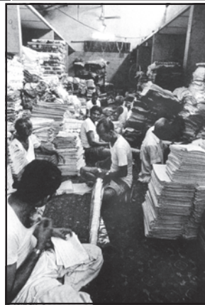
चित्रों के दो समुच्चयों में दिए गए उत्पादन के दो विभिन्न प्रकारों की चर्चा करें कारखाने में कपड़ा उत्पादन