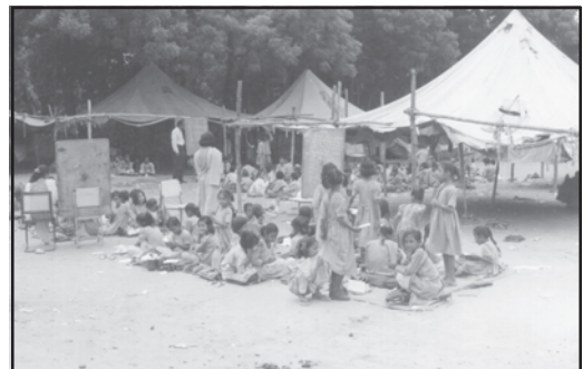
चित्रों की विवेचना करें (दो प्रकार के स्कूल)