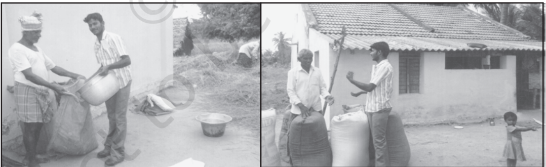
गाँव में धान की कटाई