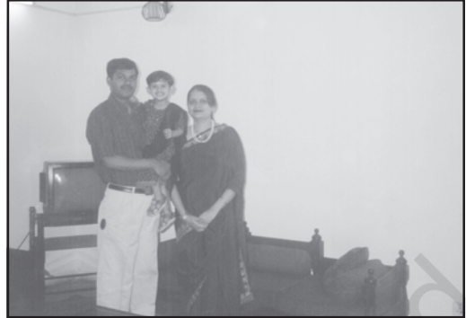
परिवारों और आवासों में अंतर पर ध्यान दीजिए