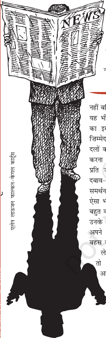
एलेन लाऊजन फाल्कन-केगल कार्टून

ऊपर के अनुच्छेद में आपको लोकतंत्र और सामाजिक आंदोलन में क्या संबंध नजर आ रहा है? इस आंदोलन को सरकार के प्रति क्या रवैया अपनाना चाहिए?