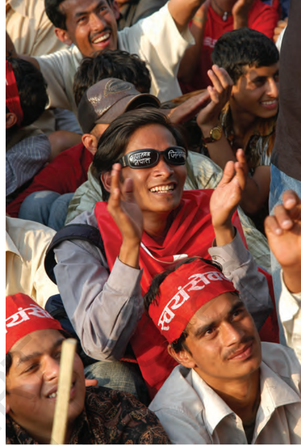
नेपाल के लोग और राजनीतिक दल एक 'रैली' में लोकतंत्र की बहालों की माँग करते हुए।

इसमें माओवादी बागी तथा अन्य संगठन भी साथ हो लिए। लोग कम्प्यू तोड़कर सड़कों पर उतर आए। तकरीबन एक लाख लोग रोजाना एकजुट होकर लोकतंत्र की बहाली की माँग कर रहे थे और लोगों की इतनी बड़ी तादाद के आगे सुरक्षा-बलों की एक न चल सकी। 21 अप्रैल के दिन आंदोलनकारियों की संख्या 3-5 लाख तक पहुँच गई और आंदोलनकारियों ने राजा को 'अल्टीमेटम' दे दिया। राजा ने आधे-अधूरे मन से कुछ रियायत देने की घोषणा की जिसे आंदोलन के नेताओं ने स्वीकार नहीं किया। नेता अपनी माँगों पर अडिग रहे कि संसद को बहाल किया जाय; सर्वदलीय सरकार बने तथा एक नयी संविधान-सभा का गठन हो।