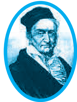
कार्ल फ्रैड्रिक गॉस (1777 – 1855)

अंकगणित की आधारभूत प्रमेय के रूप में विख्यात होने से पहले, प्रमेय 1.2 का संभवतया सर्वप्रथम वर्णन यूक्लिड के एलीमेंट्स की पुस्तक IX में साध्य (proposition) 14 के रूप में हुआ था। परंतु इसकी सबसे पहले सही उपपत्ति कार्ल फ्रैड्रिक गॉस (Carl Friedrich Gauss) ने अपनी कृति डिसक्विशंस अरिथमेटिकी (Disquisitiones Arithmeticae) में दी। कार्ल फ्रैड्रिक गॉस को प्रायः 'गणितज्ञों का राजकुमार' कहा जाता है तथा उनका नाम सभी समयकालों के तीन महानतम गणितज्ञों में लिया जाता है, जिनमें आर्किमिडीज़ (Archimedes) और न्यूटन (Newton) भी सम्मिलित हैं। उनका गणित और विज्ञान दोनों में मौलिक योगदान है।