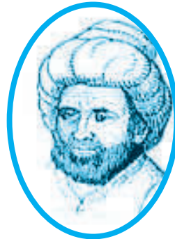
मुहम्मद इब्न मूसा अल-ख्वारिज़्मी (780 – 850 सा.यु.)

प्रमेयिका एक सिद्ध किया हुआ कथन होता है और इसे एक अन्य कथन को सिद्ध करने में प्रयोग करते हैं।