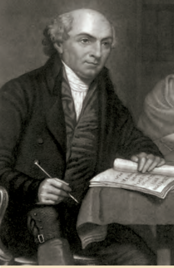
चित्र 6 - स्कॉटलैंड के ईसाई प्रचारक विलियम केरे जिसे सेरामपुर मिशन की स्थापना में मदद की।

उन्नीसवीं सदी में भारत में सक्रिय ईसाई प्रचारकों ने व्यावहारिक शिक्षा के पक्ष में दिए जा रहे तर्कों का घोर विरोध किया। प्रचारकों का मानना था कि शिक्षा का उद्देश्य लोगों के नैतिक चरित्र में सुधार लाना होता है और नैतिकता उत्थान केवल ईसाई शिक्षा के जरिए ही संभव है।