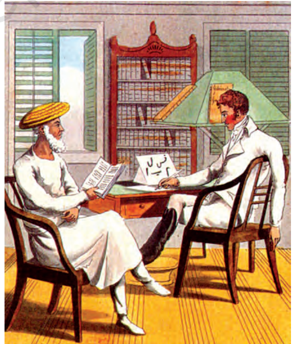
चित्र 1 - विलियम जोन्स फ़ारसी भाषा सीख रहे हैं।

सन् 1783 में विलियम जोन्स नाम के एक सज्जन कलकत्ता आए। उन्हें ईस्ट इंडिया कंपनी द्वारा स्थापित किए गए सुप्रीम कोर्ट में जूनियर जज के पद पर तैनात किया गया था। कानून का माहिर होने के साथ-साथ जोन्स एक भाषाविद भी थे। उन्होंने ऑक्सफ़र्ड में ग्रीक और लैटिन का अध्ययन किया था, वे फ्रेंच और अंग्रेज़ी जानते थे और अपने एक दोस्त से अरबी सीखने के अलावा फ़ारसी भी सीख चुके थे। कलकत्ता में