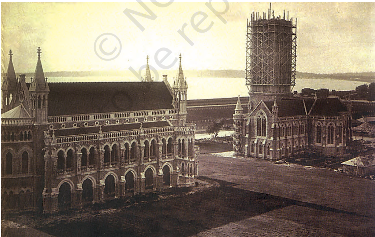
चित्र 5 - उन्नीसवीं सदी में बम्बई विश्वविद्यालय।

कल्पना कीजिए कि आप 1850 के दशक में जी रहे हैं। आपने वुड के नीतिपत्र (वुड्स डिस्पैच) के बारे में सुना है। इसके बारे में अपनी प्रतिक्रियाएँ लिखिए।