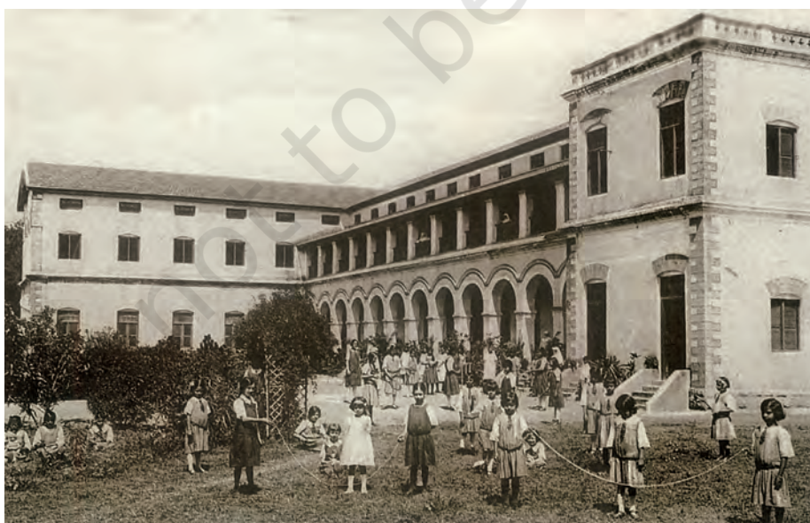
चित्र 12 - कोयम्बटूर के एक प्रचारक स्कूल में खेल रहे बच्चे, बीसवीं सदी का प्रारंभ।

इस प्रकार, बहुत सारे लोग इस बारे में सोचने लगे थे कि एक राष्ट्रीय शिक्षा प्रणाली की रूपरेखा क्या होनी चाहिए। कुछ लोग अंग्रेजों द्वारा स्थापित की गई व्यवस्था में परिवर्तन चाहते थे। उनका मानना था कि इसी व्यवस्था को इस तरह फैलाया जाए कि उसमें ज़्यादा से ज़्यादा लोगों को पढ़ने के मौके मिलें। इसके विपरीत बहुत सारे लोग ऐसे भी थे जो एक वैकल्पिक व्यवस्था चाहते थे ताकि लोगों को सच्चे अर्थों में राष्ट्रीय संस्कृति की शिक्षा दी जा सके। कौन तय करे कि सच्चे अर्थों में राष्ट्रीय क्या होता है? इस “राष्ट्रीय शिक्षा” की बहस स्वतंत्रता के बाद भी जारी रही।