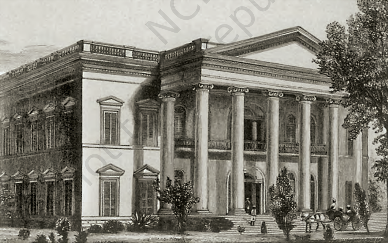
चित्र 7 - कलकत्ता के पास हुगली नदी के तट पर स्थित सेरामपुर कॉलेज।

उन्नीसवीं सदी के दौरान पूरे भारत में प्रचारक स्कूल खोले गए। परंतु 1857 के बाद भारत की ब्रिटिश सरकार प्रचारक शिक्षा को प्रत्यक्ष सहायता देने में आनाकानी करने लगी थी। सरकार को लगता था कि स्थानीय रीति-रिवाजों, व्यवहारों, मूल्य-मान्यताओं और धार्मिक विचारों से किसी भी तरह की छेड़छाड़ “देशी” लोगों को भड़का सकती है।