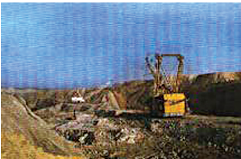
चित्र 5.2 : कोयले की एक खान।

वायु में गर्म करने पर कोयला जलता है और मुख्य रूप से कार्बन डाइऑक्साइड गैस उत्पन्न करता है।