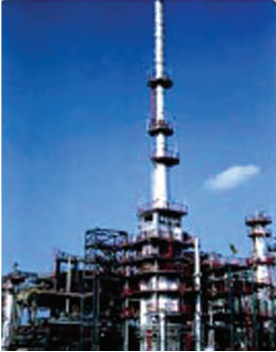
चित्र 5.5 : पेट्रोलियम परिष्करण।

को पृथक करने का प्रक्रम परिष्करण कहलाता है। यह कार्य पेट्रोलियम परिष्करण में सम्पादित किया जाता है (चित्र 5.5)।