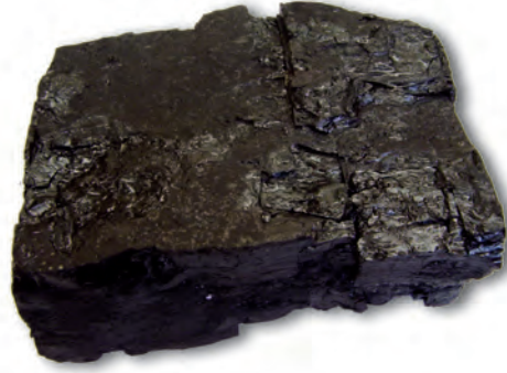
चित्र 5.1 : कोयला।

आपने कोयला देखा होगा या इसके बारे में सुना होगा (चित्र 5.1)। यह पत्थर जैसा कठोर और काले रंग का होता है।