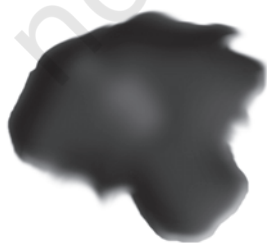
चित्र 5.3 : कोलतार।

यह एक अप्रिय गंध वाला काला गाढ़ा द्रव होता है (चित्र 5.3)। यह लगभग 200 पदार्थों का मिश्रण