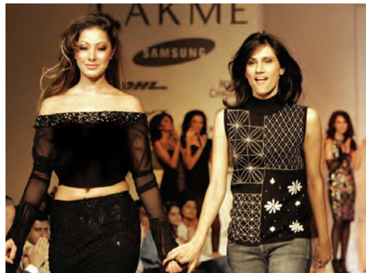
संचार माध्यमों में फैशन शो बहुत लोकप्रिय हुए हैं

कई बार ऐसी घटनाएँ हो जाती हैं, जब संचार माध्यम उन विषयों पर हमारा ध्यान केंद्रित कराने में असफल रहते हैं, जो हमारे जीवन के लिए महत्वपूर्ण हैं। उदाहरण के लिए-पीने का पानी हमारे देश की एक बड़ी समस्या है। प्रतिवर्ष हजारों लोग कष्ट सहते हैं और मर जाते हैं क्योंकि उन्हें पीने के लिए सुरक्षित पानी नहीं मिलता, फिर भी संचार माध्यम हमें इस विषय पर बहुत कम ही चर्चा करते हुए दिखाते हैं। एक सुविख्यात भारतीय पत्रकार ने लिखा है कि कैसे वस्त्रों को नया रूपाकार देने वाले डिज़ाइनरों ने 'फ़ैशन वीक' में धनवानों के समक्ष अपने नए वस्त्र प्रदर्शित करके सभी समाचारपत्रों के मुख्य पृष्ठ पर स्थान पा लिया, जबकि उसी सप्ताह मुंबई में अनेक झोपड़पट्टियों को गिरा कर दिया गया पर किसी ने इस पर ज़रा सा भी ध्यान नहीं दिया।