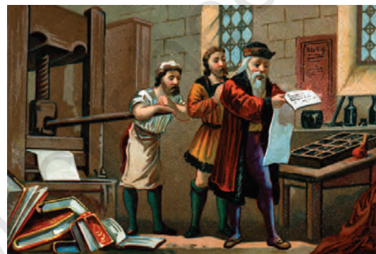
एक चित्रकार की नज़र में बाइबल के पहले पन्ने की छपाई करते हुए गुटेनबर्ग

पृष्ठ 70 पर दिए गए कोलाज में से संचार माध्यमों के छह अलग-अलग प्रकारों को छाँटिए।