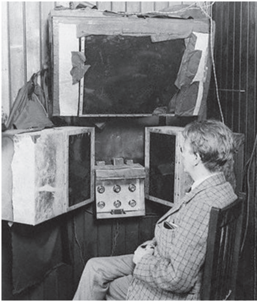
(यह यंत्र 'टेलीवाइजर', टेलीविजन का प्रारंभिक रूप था। अपने इस आविष्कार के सामने बैठे हैं - जॉन एल बर्ड। इस यंत्र के द्वारा उन्होंने रॉयल इंस्टीट्यूट के समक्ष अपने आविष्कार का प्रदर्शन किया था।

अपने प्रिय टी.वी. कार्यक्रम के दौरान विज्ञापित होने वाली तीन चीजों की सूची बनाइए।