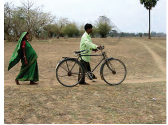
इस गर्भवती औरत को एक योग्य डॉक्टर को दिखाने के लिए कई किलोमीटर पैदल चलना पड़ रहा है।