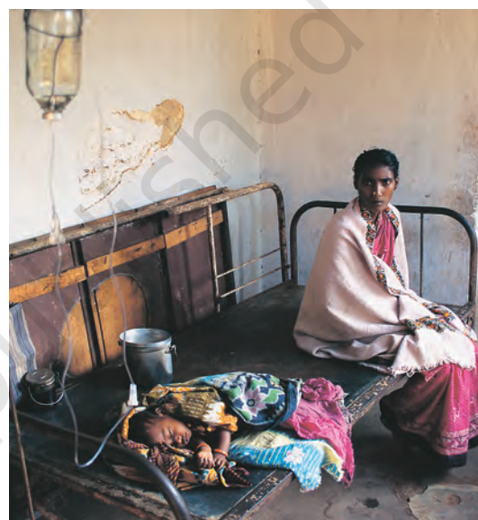
एक सरकारी अस्पताल में अपने बीमार बच्चे के साथ एक औरत। यूनिसेफ़ के अनुसार हर साल 10 लाख बच्चे ऐसे संक्रमणों से मर जाते हैं, जिन्हें रोक पाना संभव है।

किन-किन अर्थों में 'सार्वजनिक स्वास्थ्य व्यवस्था' सबके लिए उपलब्ध एक सेवा है?