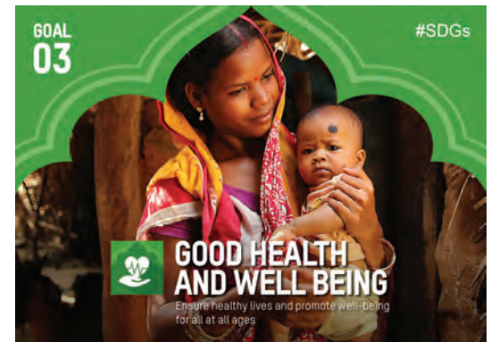
सतत विकास लक्ष्य 3: उत्तम स्वास्थ्य और खुशहाली www.in.undp.org