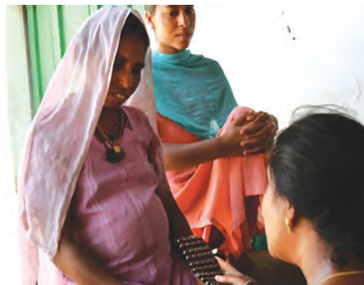
गाँव के एक स्वास्थ्य केंद्र में मरीज को दवाई देती एक डॉक्टर।

हमारे देश में कई तरह की निजी स्वास्थ्य सेवाएँ पाई जाती हैं। बड़ी संख्या में डॉक्टर अपने निजी दवाखाने चलाते हैं। ग्रामीण क्षेत्रों में पंजीकृत चिकित्सा व्यवसायी (आर.एम.पी.) मिल जाते हैं। शहरी क्षेत्रों में बड़ी संख्या में डॉक्टर हैं जिनमें से बहुत-से विशेषज्ञ की सेवाएँ प्रदान करते हैं। निजी रूप से चलाए जा रहे अस्पताल व नर्सिंग होम भी हैं। काफ़ी संख्या में प्रयोगशालाएँ हैं, जो परीक्षण करती हैं व विशिष्ट सुविधाएँ उपलब्ध कराती हैं, जैसे—एक्सरे, अल्ट्रासाउंड, आदि। ऐसी दुकानें भी हैं, जहाँ से हम दवाइयाँ खरीद सकते हैं।