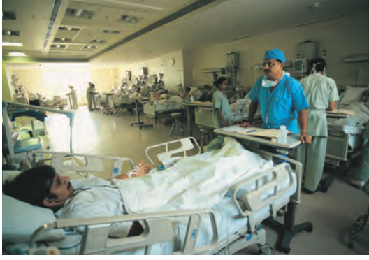
दिल्ली के एक प्रमुख निजी अस्पताल में ऑपरेशन के बाद मरीजों की देखभाल का कमरा।

आपके घर के पास कौन-सी निजी स्वास्थ्य सेवाएँ उपलब्ध हैं? उन्हें चलाने वाले लोगों और वहाँ दी जाने वाली सुविधाओं का पता लगाइए।