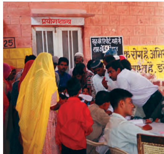
सरकारी अस्पतालों के मरीजों को अकसर ऐसी लंबी लाइनों में खड़े होकर इंतजार करना पड़ता है।

फिर भी दूसरा स्तंभ दिखाता है कि हमारे देश में स्वास्थ्य की स्थिति कितनी खराब है। उपर्युक्त सकारात्मक विकास के बाद भी हम जनता को उचित स्वास्थ्य सेवाएँ देने में असमर्थ हैं। यह विरोधाभासजनक स्थिति है, जो हमारी अपेक्षाओं के विपरीत है। हमारे देश के पास पैसा है, ज्ञान है और अनुभवी व्यक्ति हैं, फिर भी हम सबको आवश्यक स्वास्थ्य सेवाएँ देने में असमर्थ हैं। हम इस अध्याय में इसके कुछ कारणों को जानेंगे।