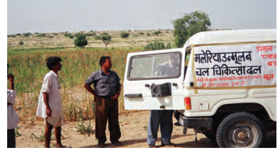
ग्रामीण इलाकों में अक्सर एक जीप ही मरीजों के लिए चलता-फिरता दवाखाना बन के आती है।

इसमें कोई संदेह नहीं है कि हमारे देश में लोगों के स्वास्थ्य की दशा अच्छी नहीं है। यह सरकार का उत्तरदायित्व है कि वह अपने सब नागरिकों को, विशेषकर गरीबों और सुविधाहीनों को, गुणात्मक स्वास्थ्य सेवाएँ प्रदान करे। फिर भी लोगों का स्वास्थ्य, जितना जीवन की आधारभूत सुविधाओं पर और उनकी सामाजिक स्थिति पर निर्भर है, उतना ही स्वास्थ्य सेवाओं के ऊपर भी। इसलिए लोगों के स्वास्थ्य की दशा सुधारने के लिए दोनों पक्षों पर कार्य करना आवश्यक है। ऐसा करना संभव है। अगले पृष्ठ पर दिए गए उदाहरण देखिए—