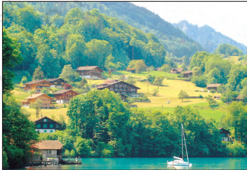
चित्र 7.1 : मानव बस्ती