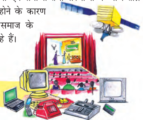
चित्र 7.10 : संचार माध्यमों का विकास