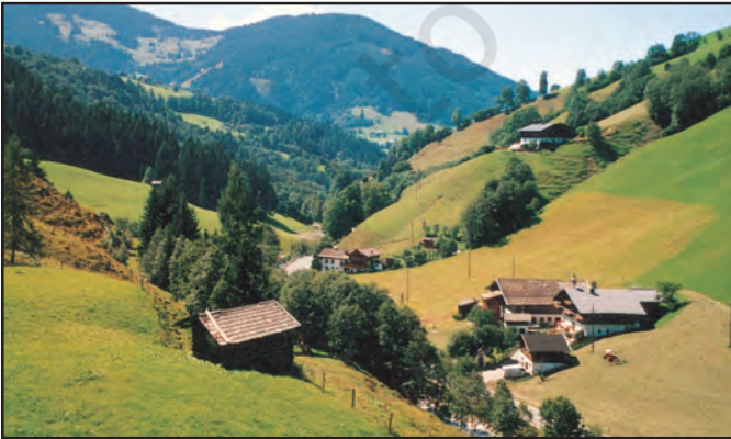
चित्र 7.3 : प्रकीर्ण बस्ती

ऊपर दिए गए संवाद से बस्तियों के दो विभिन्न चित्रण हमारे सामने आते हैं— ग्रामीण एवं शहरी बस्तियाँ। गाँव, ग्रामीण बस्ती होती है; जहाँ लोग कृषि, मत्स्य पालन, वानिकी, दस्तकारी एवं पशुपालन संबंधी कार्य करते हैं। ग्रामीण बस्ती सघन या प्रकीर्ण हो सकती है। सघन बस्तियों में घर पास-पास बने होते हैं (चित्र 7.2)। प्रकीर्ण बस्तियों में लोगों के घर दूर-दूर व्यापक क्षेत्र में फैले होते हैं। इस प्रकार की बस्तियाँ मुख्यतः पहाड़ी क्षेत्रों, घने जंगल एवं अतिविषम जलवायु वाले क्षेत्रों में पाई जाती हैं (चित्र 7.3)।