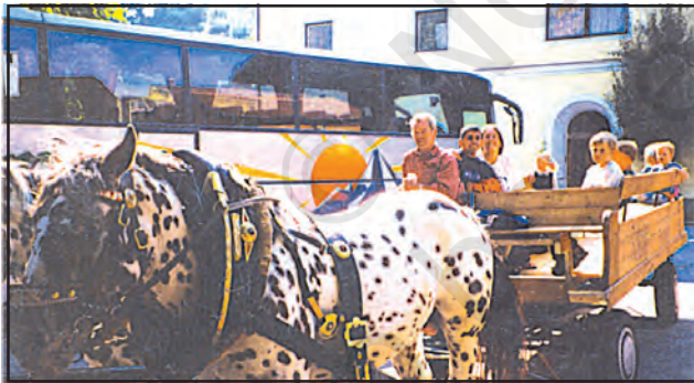
चित्र 7.5 : यातायात के साधन के रूप में घोड़ागाड़ी

परिवहन लोगों एवं सामान के आवागमन के साधन होते हैं। पुराने समय में अधिक दूरी की यात्रा करने में अत्यधिक समय लगता था। उस समय लोग पैदल चलते थे एवं अपने सामान को ढोने के लिए पशुओं का उपयोग करते थे। पहिए की खोज से परिवहन आसान हो गया। समय के साथ परिवहन के विभिन्न साधनों का विकास होता गया, लेकिन आज भी लोग परिवहन के लिए पशुओं का उपयोग करते हैं (चित्र 7.5)।