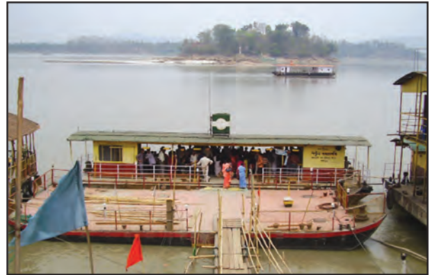
चित्र 7.8 : अंतर्देशीय जलमार्ग

समुद्री एवं महासागरीय मार्गों का उपयोग सामान्यतः व्यापारिक माल एवं समान को एक देश से दूसरे देश में पहुँचाने के लिए करते हैं। ये मार्ग पत्तनों से जुड़े होते हैं। विश्व के कुछ महत्वपूर्ण पत्तन हैं—एशिया में सिंगापुर एवं मुंबई, उत्तर अमेरिका में न्यूयॉर्क एवं लॉस एंजिल्स, दक्षिण अमेरिका में रियो डि जेनेरियो, अफ्रीका में डरबन एवं केपटाउन, आस्ट्रेलिया में सिडनी, यूरोप में लंदन (चित्र 7.11)। क्या आप विश्व के कुछ और पत्तनों के भी नाम बता सकते हैं?