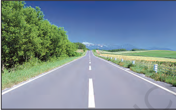
चित्र 7.6 : पक्की सड़क

कम दूरी यातायात के सबसे अधिक उपयोग किए जाने वाले मार्ग सड़क हैं। सड़कें पक्की एवं कच्ची हो सकती हैं (चित्र 7.6 एवं 7.7)। मैदानी क्षेत्रों में सड़कों का घना जाल बिछा है। मरुस्थलों, वनों एवं ऊँचे पर्वत जैसे स्थानों पर भी सड़कें बनी हुई हैं। हिमालय पर्वत पर मनाली-लेह राजमार्ग विश्व के सबसे ऊँचे सड़क मार्गों में से एक है। भूमिगत सड़कों को भूमिगत मार्ग (सब वे) कहते हैं। फ्लाईओवर, उत्थित संरचनाओं के ऊपर बनाए जाते हैं।