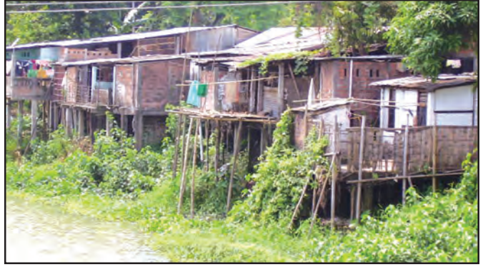
चित्र 7.4 : स्टिल्ट पर मकान

नगरीय बस्तियों में नगर छोटी एवं शहर उनसे बड़ी बस्तियाँ होती हैं। नगरीय क्षेत्रों में लोग निर्माण, व्यापार एवं सेवा क्षेत्रों में कार्यरत होते हैं। अपने राज्य के कुछ गाँवों, नगरों एवं शहरों के नाम लिखिए।