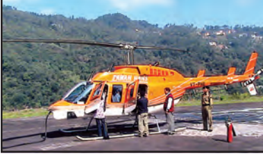
चित्र 7.9 : हेलीकॉप्टर

बीसवीं सदी के आरंभ में विकसित यह परिवहन का सबसे तीव्र मार्ग है। ईंधन की लागत अधिक होने के कारण यह सर्वाधिक महंगा साधन है। वायु यातायात खराब मौसम, जैसे-कुहरे एवं तूफान से कुप्रभावित होता है। यह यातायात का अकेला साधन है, जो सर्वाधिक दुर्गम एवं दुरूह स्थानों तक पहुँच सकता है, विशेष रूप से जहाँ सड़क एवं रेलमार्ग नहीं हैं। हेलीकॉप्टर अगम्य स्थानों एवं संकटकालीन स्थितियों में लोगों को बचाने एवं भोजन, जल, कपड़े एवं दवाएँ बाँटने के लिए एक बहुत ही उपयोगी साधन है (चित्र 7.9)। कुछ महत्वपूर्ण हवाई पत्तन हैं : दिल्ली, मुंबई, न्यूयॉर्क, लंदन, पेरिस, फ्रैंकफर्ट एवं काहिरा (चित्र 7.11)।