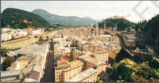
चित्र 7.2 : सघन बस्ती

अस्पताल नहीं हैं, लेकिन हमारे यहाँ बहुत सारी खुली भूमि एवं साँस लेने के लिए ताज़ी हवा मिलती है। जब मेरे दादा जी बीमार थे, तो उनको शहर के अस्पताल में लाना पड़ा था।”