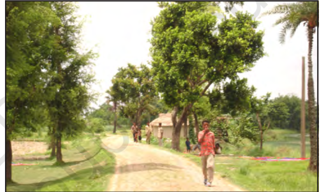
चित्र 7.7 : कच्ची सड़क