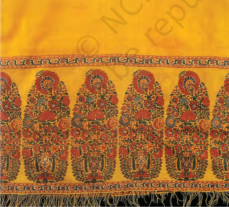
चित्र 5 शॉल का बॉर्डर