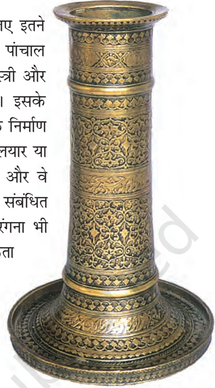
चित्र 4 पीतल के इस मोमबत्तीदान पर काला आवरण है।

बीदर के शिल्पकार ताँबे तथा चाँदी में जड़ाई के काम के लिए इतने अधिक प्रसिद्ध थे कि इस शिल्प का नाम ही 'बीदरी' पड़ गया। पांचाल अर्थात् विश्वकर्मा समुदाय जिसमें सुनार, कसेरे, लोहार, राजमिस्त्री और बढई शामिल थे; मंदिरों के निर्माण के लिए आवश्यक थे। इसके अलावा वे राजमहलों, बड़े-बड़े भवनों, तालाबों और जलाशयों के निर्माण में भी अपनी महत्वपूर्ण भूमिका अदा करते थे। इसी प्रकार सालियार या कैक्कोलार जैसे बुनकर भी समृद्धिशाली समुदाय बन गए थे और वे मंदिरों को भारी दान-दक्षिणा दिया करते थे। वस्त्र-निर्माण से संबंधित कुछ अन्य कार्य, जैसे-कपास को साफ़ करना, कातना और रंगना भी स्वतंत्र व्यवसाय बन गए थे, जिनके लिए विशेषज्ञता की आवश्यकता होती थी।