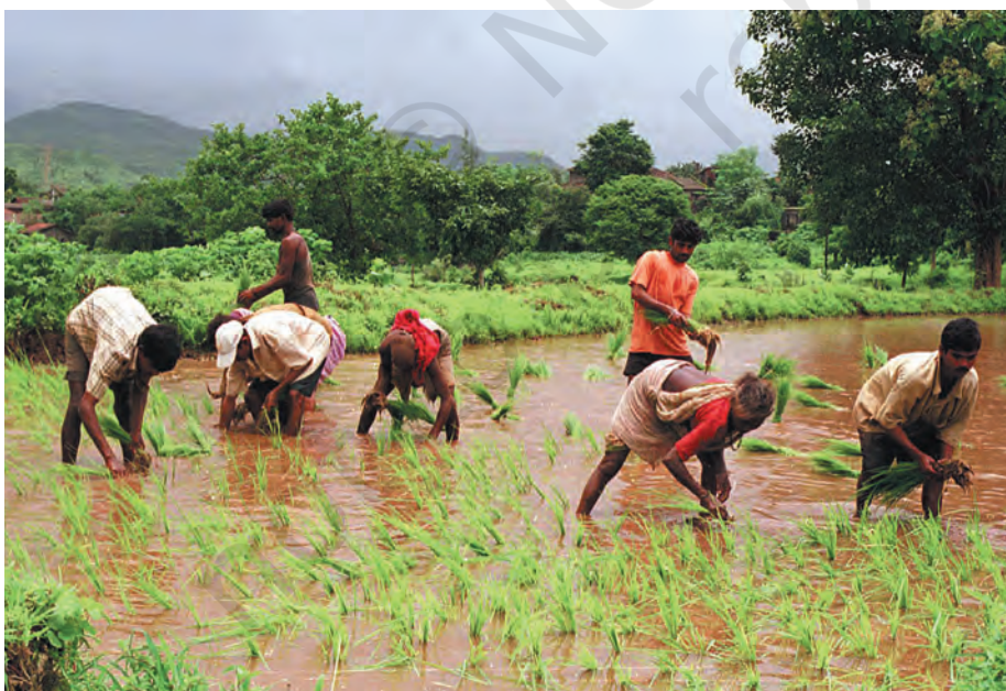
धान की रोपाईं कमरतोड़ काम होता है

कलपट्टु में कुछ लोग नर्स, शिक्षक, धोबी, बुनकर, नाई, साइकिल ठीक करने वाले और लोहार के रूप में अपनी सेवाएँ देते हैं। यहाँ कुछ दुकानदार एवं व्यापारी भी हैं। जो मुख्य गली है वह बाज़ार की तरह दिखती है। उसमें आपको तरह-तरह की कई छोटी दुकानें दिखेंगी जैसे चाय, सब्ज़ी, कपड़े की दुकान तथा दो दुकानें बीज और खाद की। चार दुकानें चाय की हैं जहाँ 'टिफ़िन' भी मिलता है। यहाँ