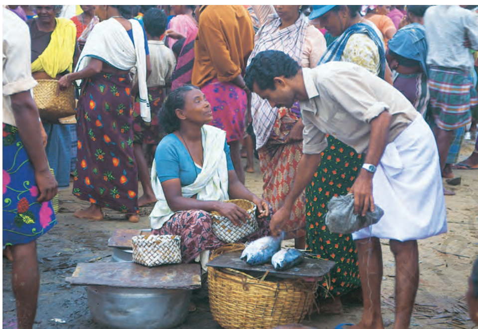
स्थानीय बाजार में मछलियाँ बेचती हुई मछुआरिनें

होता है। इन महीनों में हम व्यापारी से उधार लेकर अपना गुज़ारा चलाते हैं। इस कारण बाद में हमें मजबूरी में उसी व्यापारी को मछली बेचनी पड़ती है और हम खुद खुली नीलामी