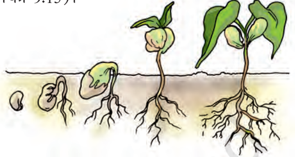
चित्र 9.15 एक पौधे का बीज अंकुरित होकर नया पौधा बनता है

पौधे भी प्रजनन करते हैं? जंतुओं की तरह पौधों में भी प्रजनन के तरीके भिन्न-भिन्न हैं। बहुत-से पौधे बीजों द्वारा प्रजनन करते हैं। पौधे बीज उत्पादित करते हैं। हम उन्हें अंकुरित करके नए पौधे उगा सकते हैं (चित्र 9.15)।