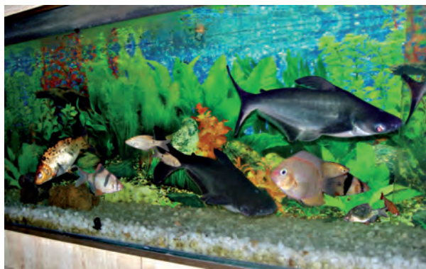
चित्र 9.3 विभिन्न प्रकार की मछलियाँ

में रहने योग्य बनाती है। ऊँट के पैर लंबे होते हैं जिससे उसका शरीर रेत की गरमी से दूर रहता है (चित्र 9.2)। उनमें मूत्रोत्सर्जन की मात्रा बहुत कम होती है तथा मल शुष्क होता है। उन्हें पसीना (स्वेद) भी नहीं आता क्योंकि शरीर से जल का हास बहुत कम होता है। इसलिए जल के बिना भी वे अनेक दिनों तक रह सकते हैं।