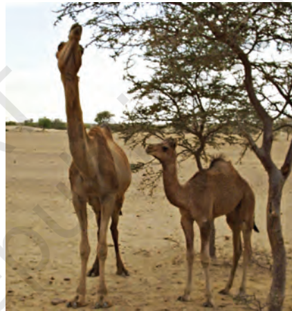
चित्र 9.2 ऊँट एवं उनका परिवेश

मरुस्थल में जल बहुत कम मात्रा में उपलब्ध होता है। मरुस्थल दिन में बहुत गरम एवं रात में ठंडा होता है। मरुस्थल में पाए जाने वाले पौधे एवं जंतु भूमि पर रहते हैं एवं श्वसन के लिए आस-पास की वायु का उपयोग करते हैं।