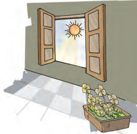
चित्र 9.12 पौधे की सूर्य के प्रकाश के प्रति अनुक्रिया

एक कमरे की खिड़की जिससे दिन के समय धूप (सूर्य का प्रकाश) आती हो, के पास एक पौधे का