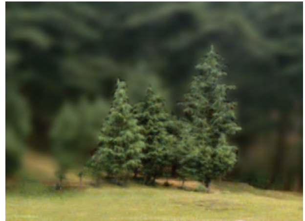
चित्र 9.6 पर्वतीय आवास के कुछ वृक्ष

पर्वतीय क्षेत्रों में पौधों एवं जंतुओं की अनेक प्रजातियाँ पाई जाती हैं। क्या आपने चित्र 9.6 में दर्शाए गए वृक्ष देखे हैं?