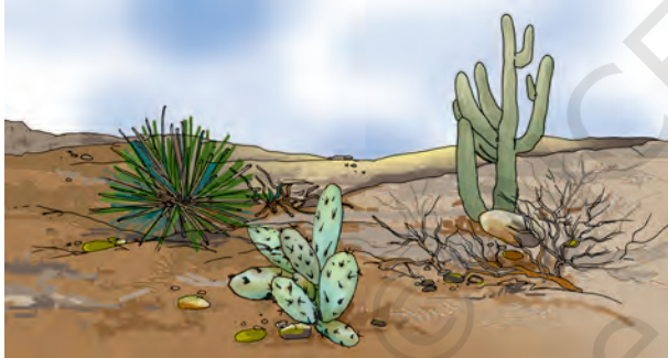
चित्र 9.5 मरुस्थल में उगने वाले कुछ पौधे

मरुस्थल में रहने वाले चूहे एवं साँप के, ऊँट की भाँति लंबे पैर नहीं होते। दिन की तेज़ गरमी से बचने के लिए वे भूमि के अंदर गहरे बिलों में रहते हैं (चित्र 9.4)। रात्रि के समय जब तापमान में कमी आती है, तो ये जंतु बाहर निकलते हैं।