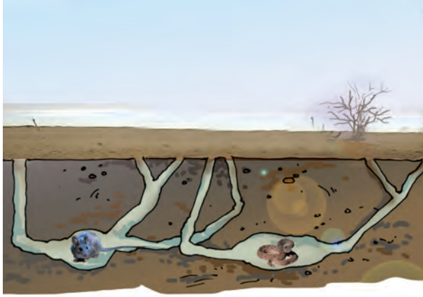
चित्र 9.4 बिल में मरुस्थलीय जंतु

मरुस्थल में रहने वाले चूहे एवं साँप के, ऊँट की भाँति लंबे पैर नहीं होते। दिन की तेज़ गरमी से बचने के लिए वे भूमि के अंदर गहरे बिलों में रहते हैं (चित्र 9.4)। रात्रि के समय जब तापमान में कमी आती है, तो ये जंतु बाहर निकलते हैं।