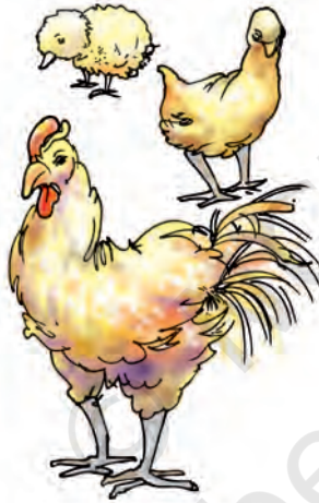
चित्र 9.11 एक चूजा वृद्धि कर वयस्क हो जाता है

पौधे भी वृद्धि करते हैं। अपने चारों ओर पाए जाने वाले विभिन्न प्रकार के पौधों का अवलोकन कीजिए। इनमें से कुछ बहुत छोटे तथा नवजात हैं तो कुछ विकसित हैं। ये सभी वृद्धि की विभिन्न