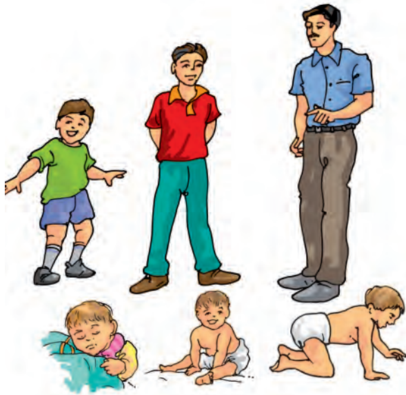
चित्र 9.10 एक शिशु वृद्धि करके वयस्क हो जाता है

का बच्चा) वृद्धि करके मुर्गी अथवा मुर्गा में परिवर्तित हो जाता है (चित्र 9.11)।