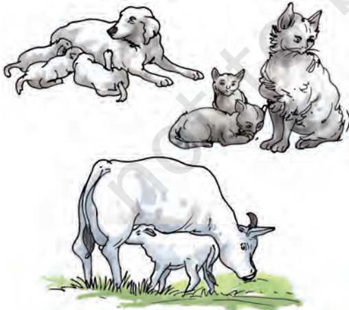
चित्र 9.14 बच्चे देने वाले कुछ जंतु

जंतु प्रजनन द्वारा अपने समान संतान उत्पन्न करते हैं। भिन्न जंतुओं में प्रजनन का ढंग अलग-अलग होता है। कुछ जंतु अंडे देते हैं जिनसे शिशु निकलते हैं। कुछ जंतु शिशु को जन्म देते हैं (चित्र 9.14)।