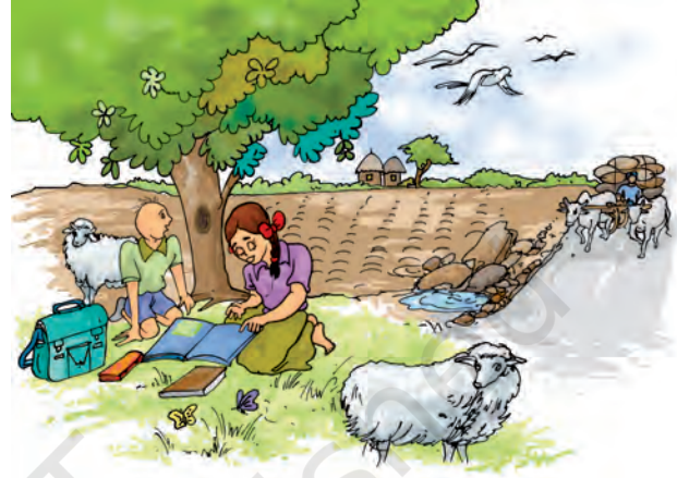
चित्र 9.1 सजीवों के लिए खोज

उन्होंने यह जानने की कोशिश की कि क्या पृथ्वी पर कोई ऐसा भी स्थान है, जहाँ कोई भी जीव नहीं पाया जाता। बूझो ने अपने घर के आस-पास के स्थानों का ध्यान किया। घर के अंदर उसने अलमारी एवं दरवाजों को देखा। उसने सोचा था कि इनमें कोई सजीव नहीं होगा, परंतु उसे एक छोटी-सी मकड़ी नज़र आई। घर से बाहर भी वह किसी ऐसे स्थान के बारे में नहीं सोच पाया जहाँ किसी न किसी प्रकार के जीव न पाए जाते हों (चित्र 9.1)। पहेली ने दूर-दूर के स्थानों के विषय में पढ़ना एवं सोचना प्रारंभ किया। उसे पता लगा कि लोगों ने तो ज्वालामुखी के मुख (मुहाने) में भी सूक्ष्म जीवों को खोज निकाला है।